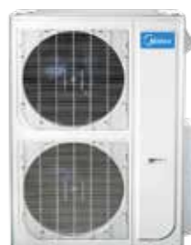
*เฉพาะขนาด 42K, 48K, 60K

*รูปภาพประกอบเพื่อการโฆษณาเท่านั้นสินค้าจริงอาจจะแตกต่างกับโปสเตอร์อยู่กัแต่ละรุ่น