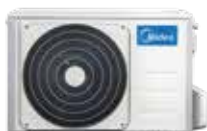
*เฉพาะขนาด 24K, 30K, 36K